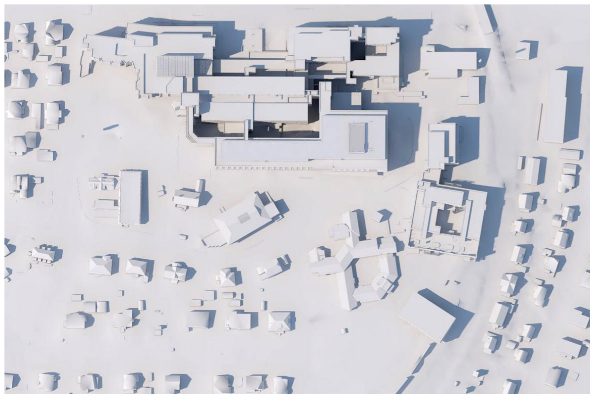
21 juni, 1500