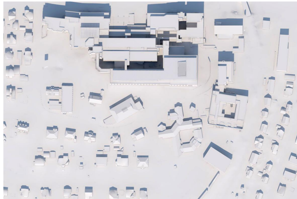
21 juni, 1200