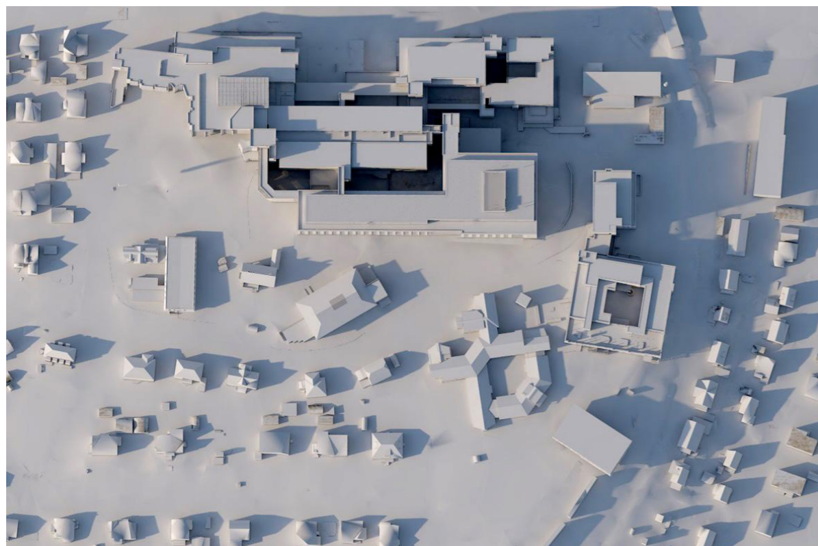
21 mars, 1500